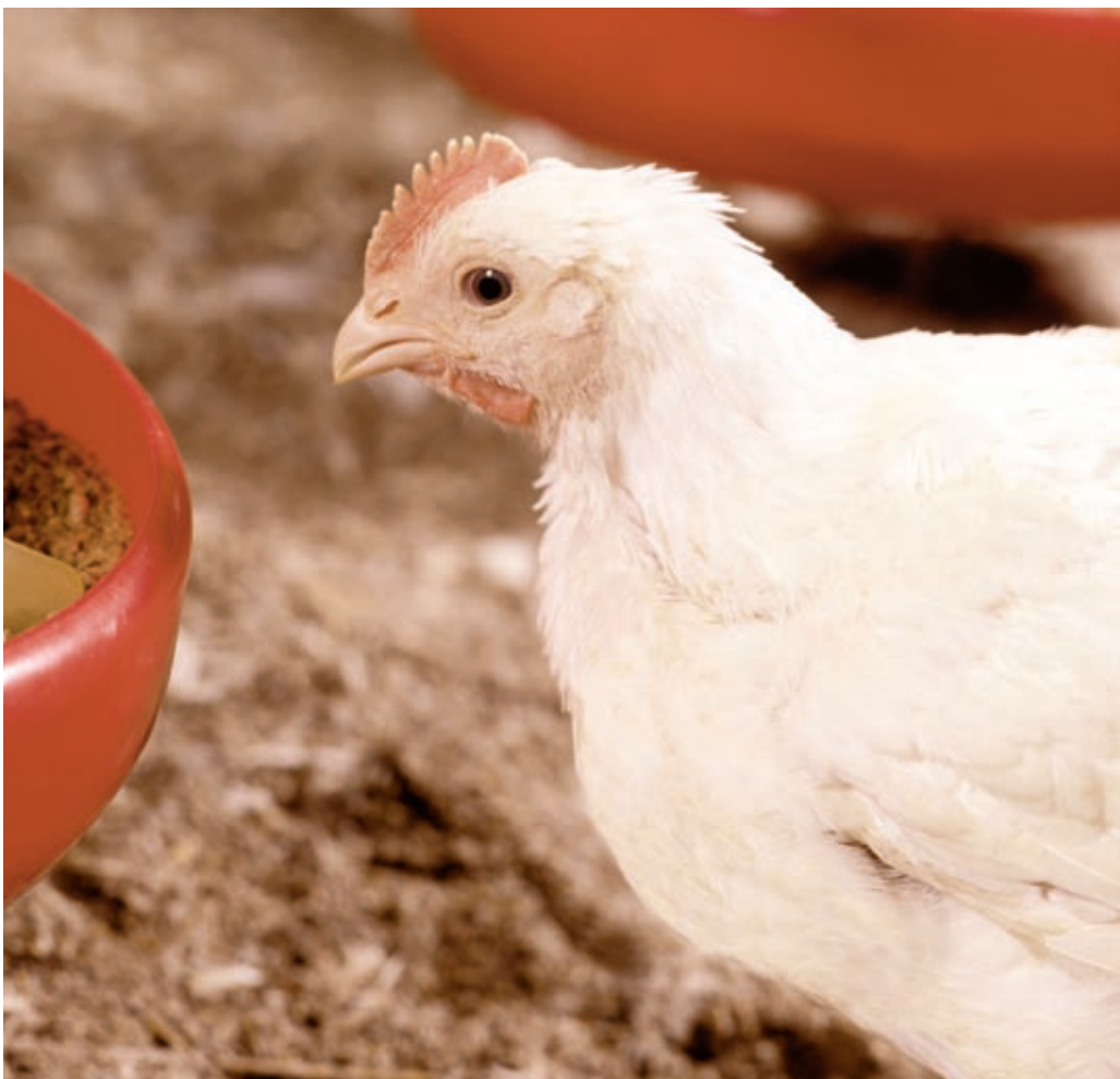
Mit Hilfe des Monitoringprogramms werden mögliche Ursachen von Campylobacter-Infektionen untersucht.

Die Niederlande treiben auch die Campylobacter-Bekämpfung weiter voran. So arbei-