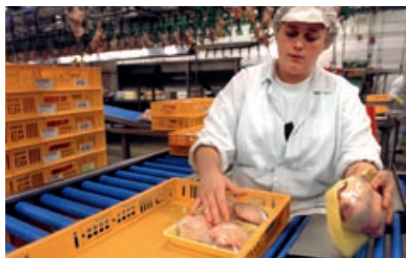
Die Integrierte Kettenüberwachung (IKB) garantiert in allen Produktionsabläufen Rückverfolgbarkeit und Transparenz.

Geflügelfleischbranche hat die Weichenstellung für eine nachhaltige und international wettbewerbsfähige Geflügelwirtschaft bereits vorgenommen. Ein Eckpfeiler ist zweifellos das nationale Qualitätssicherungs-System IKB-KIP, an dem insgesamt mehr als 1.500 Unternehmen aus allen Stufen der Erzeugung und Verarbeitung, darunter auch 145 deutsche Hähnchenmäster, teilnehmen.